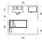
échelle 1:100 poids 464,65 kg | volume 2,19 m 3